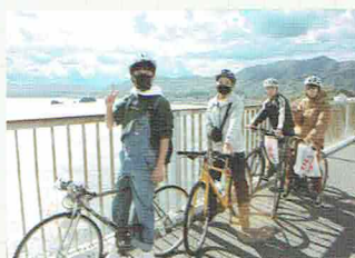
修学旅行 (広島～岡山) (R3.11.23～11.26 3泊4日)