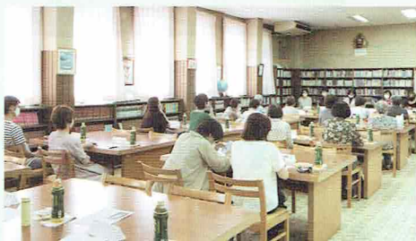
▶ 2021年10月9日 清水西高にて

2022年10月22日(土)令和4年度第1回評議員会を清水テルサにて開催しました。