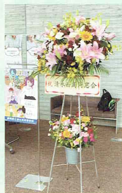
▶ 6月16日(木) 18日(土) ともえ祭