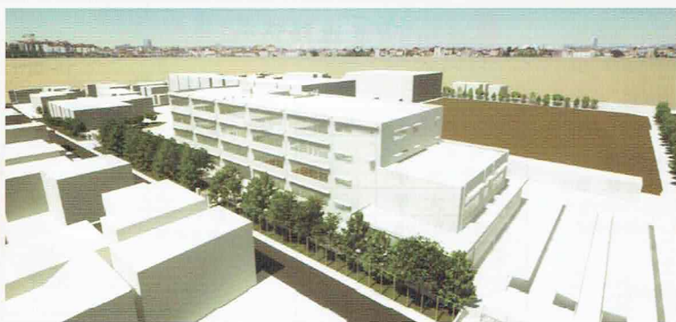
▶ 新校舎の完成イメージ

残念なことに、長く親しんだ図書館は取り壊しとなりますが、生徒が学びやすい新校舎の誕生を期待したいと思います。