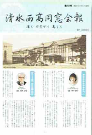
▶ 清水西高同窓会報第10号

会報10号は、西高創立110周年を記念し、西高の110年の沿革、記念事業等を掲載し発行しました。発送作業は、外部に委託しました。